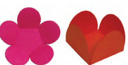
papel cartão vincado

A ferramenta permite a reprodução dos vincos no desenvolvimento de embalagens em papel cartão, PP e papel ondulado, com pressão ajustável entre 500 a 1,500g, dependendo do material.