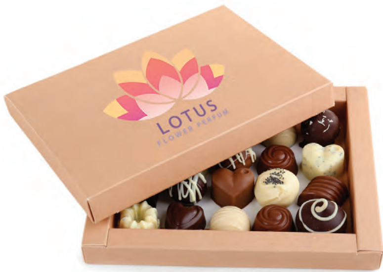
Caixa de Bombons