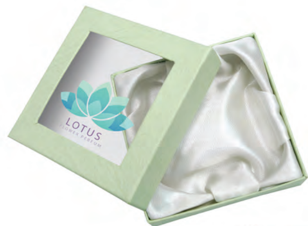
Embalagens de Presentes